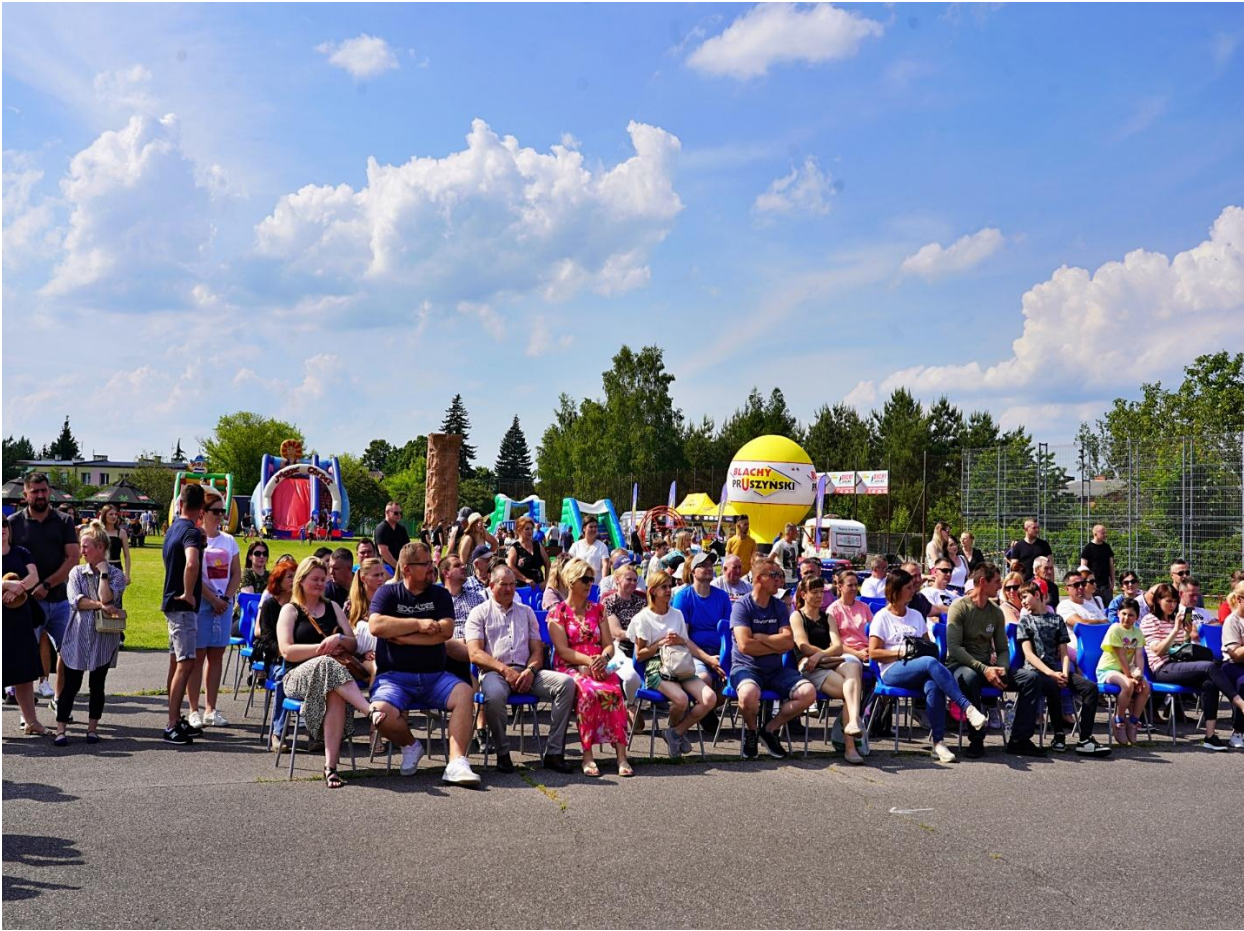
1.06.2025r. Festyn Rodzinny z okazji Dnia Dziecka i Spartakiada Solectw.