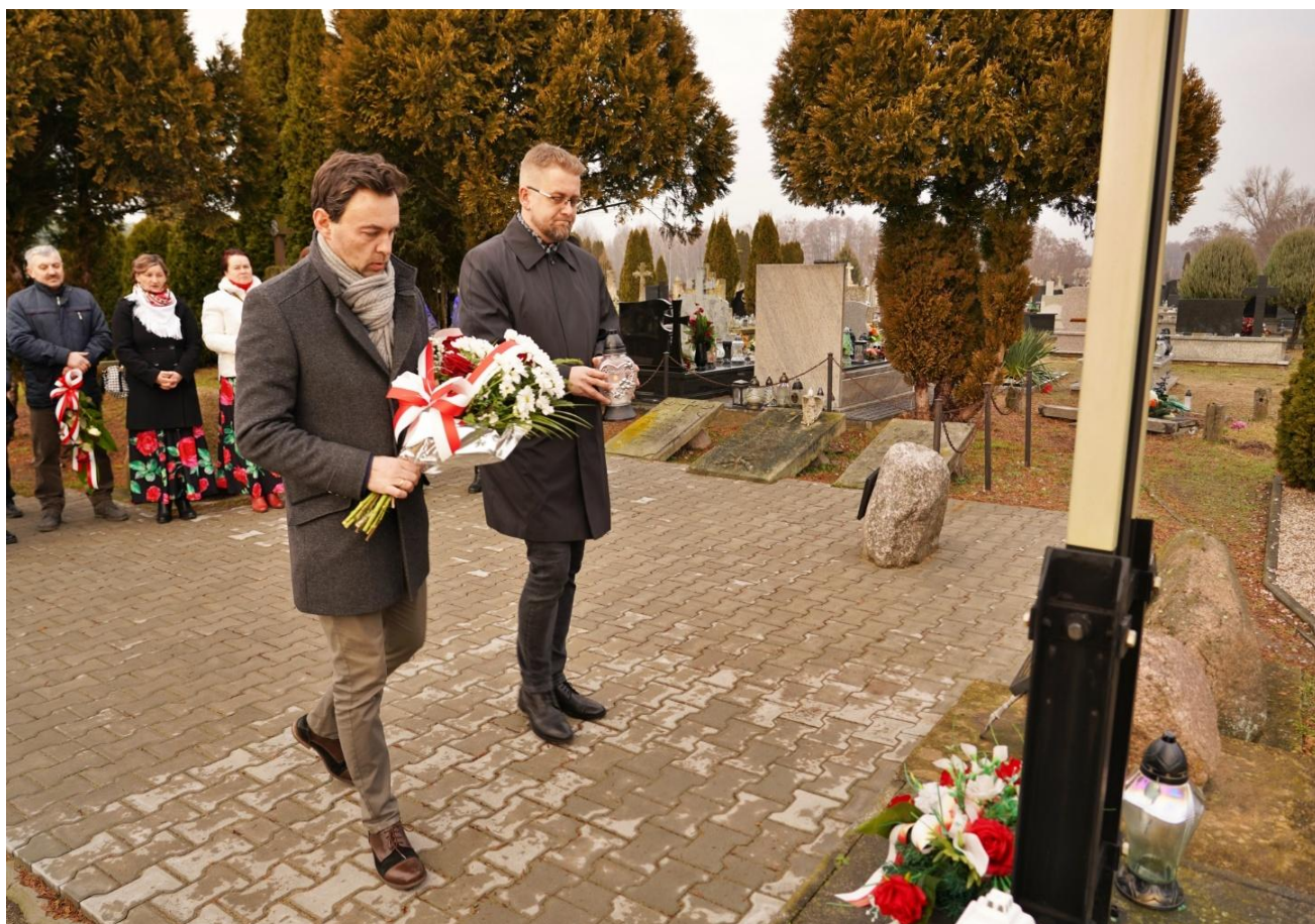
22.01.2025r. delegacja gminy Gniewoszków składa kwiaty - kwatery powstańców na cmentarzu parafialnym w Oleksowie.

W roku 2025 Gmina Gniewoszków nie ogłaszała otwartych konkursów ofert na realizację zadań publicznych ani nie powierzyła zadań publicznych organizacjom pozarządowym oraz innym podmiotom prowadzącym działalność pożytku publicznego. Ponadto, nie wykazywano zainteresowania ze strony wymienionych organizacji oraz podmiotów o których mowa w art. 3 ust. 3 ustawy o działalności pożytku publicznego i o wolontariacie, co do nawiązania współpracy przy realizacji zadań publicznych. W konsekwencji, nie zaistniała potrzeba wydatkowania żadnych środków na ten cel ze środków budżetu gminy.