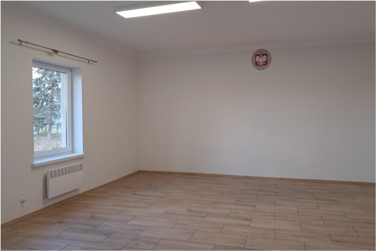
Remont świetlicy wiejskiej w miejscowości Regów Stary