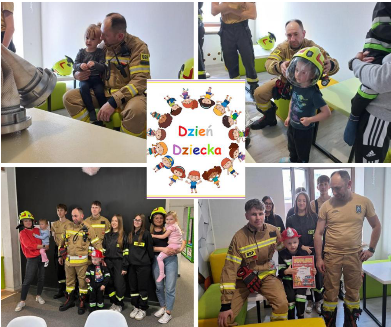
Wizyta druhów z OSP Gniewoszów w sali zabaw FUN CLUB.

Spotkania strażaków z dziećmi to niezwykle ważny element edukacji społecznej. Organizowane w szkołach, przedszkolach i salach zabaw pogadanki nie tylko przybliżają najmłodszym specyfikę pracy strażaka, ale przede wszystkim uczą zasad bezpieczeństwa oraz właściwego zachowania w sytuacjach zagrożenia. Strażacy z OSP Gniewoszów odwiedzili dzieci w sali zabaw FUN CLUB z okazji Dnia Dziecka. Podczas wizyty druhowie OSP w przystępny i ciekawy sposób opowiedzieli o swojej codziennej służbie. Dzieci dowiedziały się jak wygląda akcja ratownicza i współpraca zespołowa. Szczególnym zainteresowaniem cieszył się pokaz sprzętu -możliwość zobaczenia z bliska, a nawet przymierzenia hełmu to dla najmłodszych ogromna atrakcja. Każde dziecko otrzymało Dyplom Małego Strażaka.