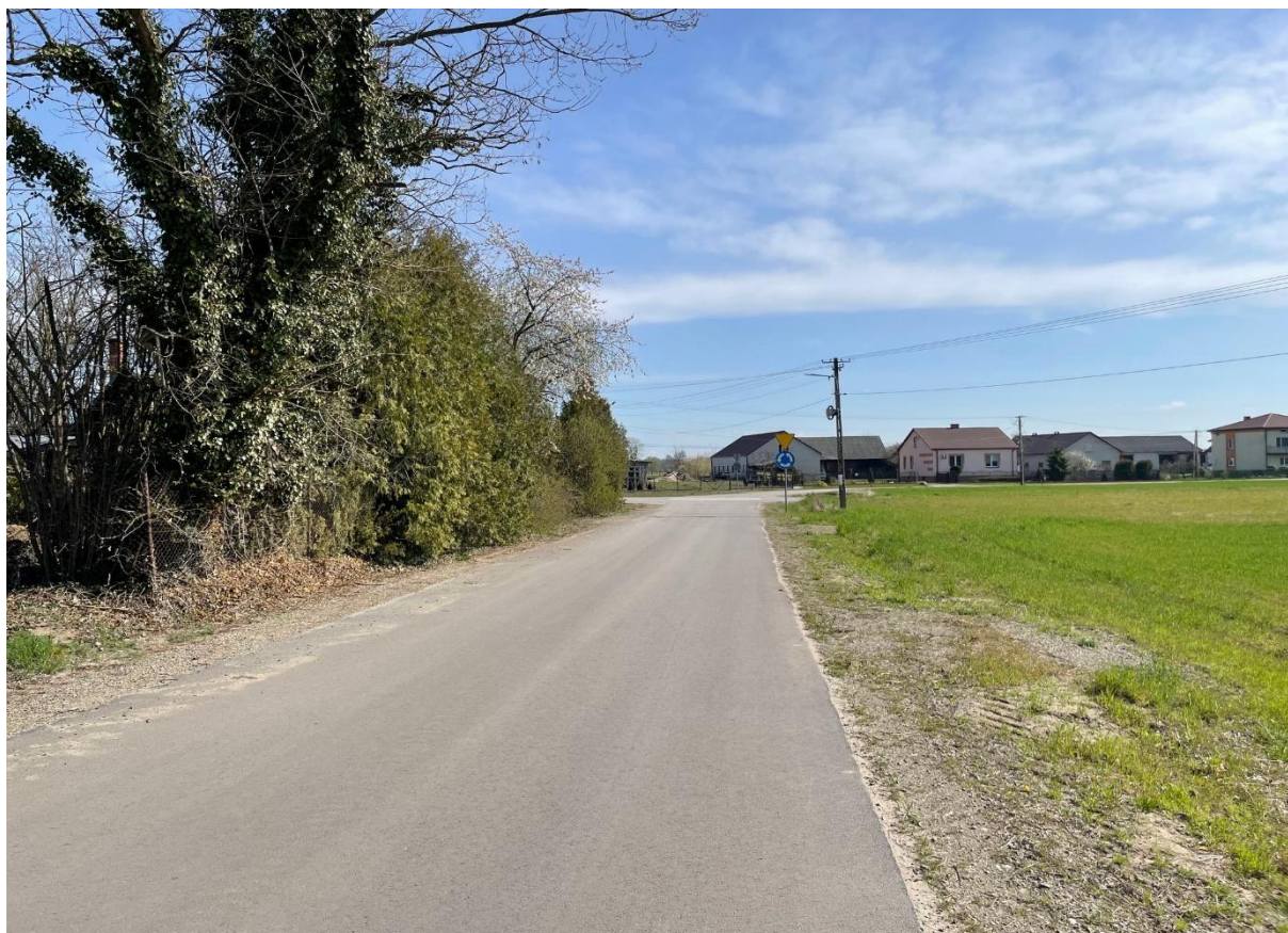
Budowa odcinka drogi w m. Sławczyn