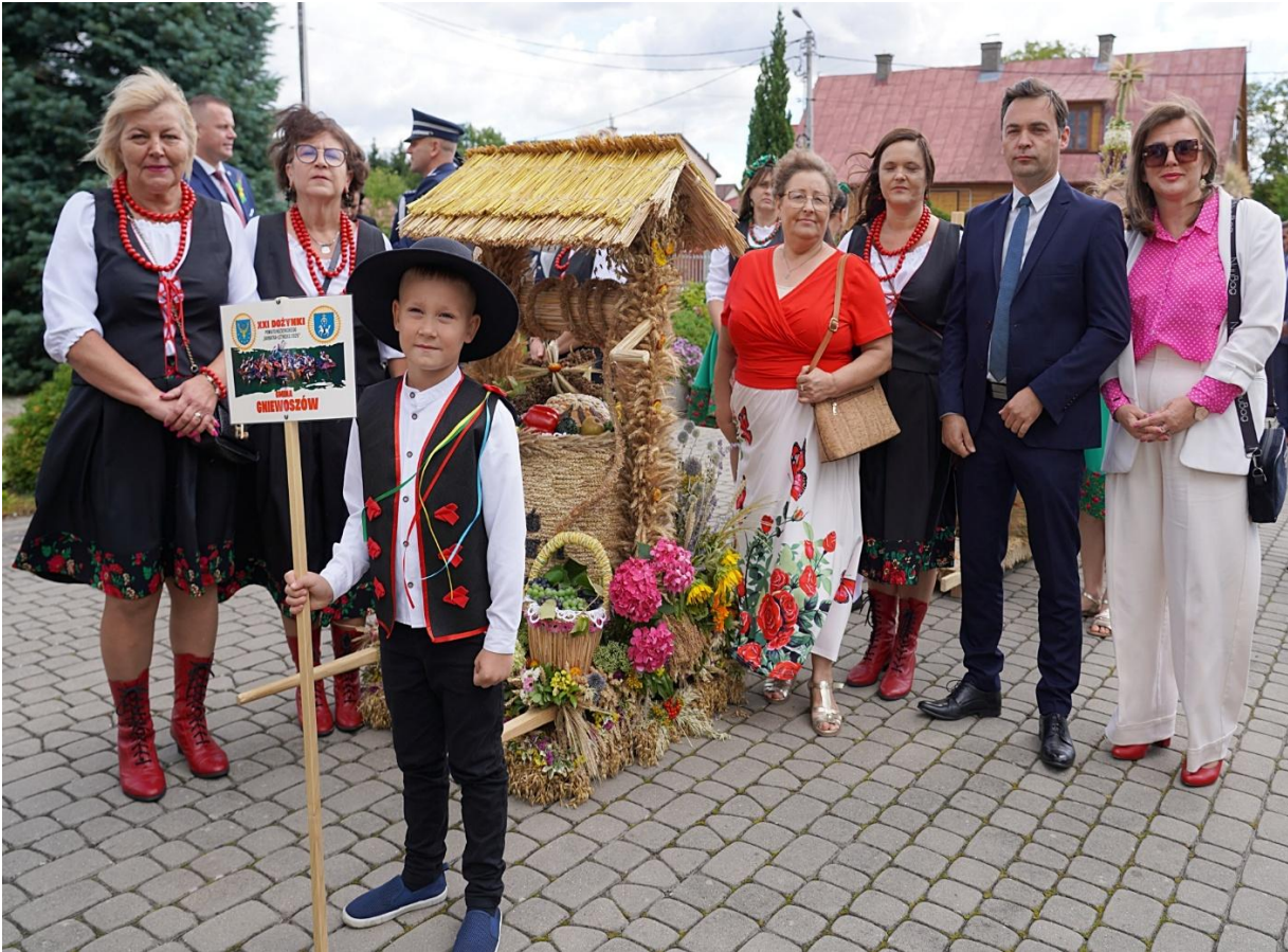
24.08.2025r. udział delegacji gminy Gniewoszów w Dożynkach Powiatu Kozienickiego.