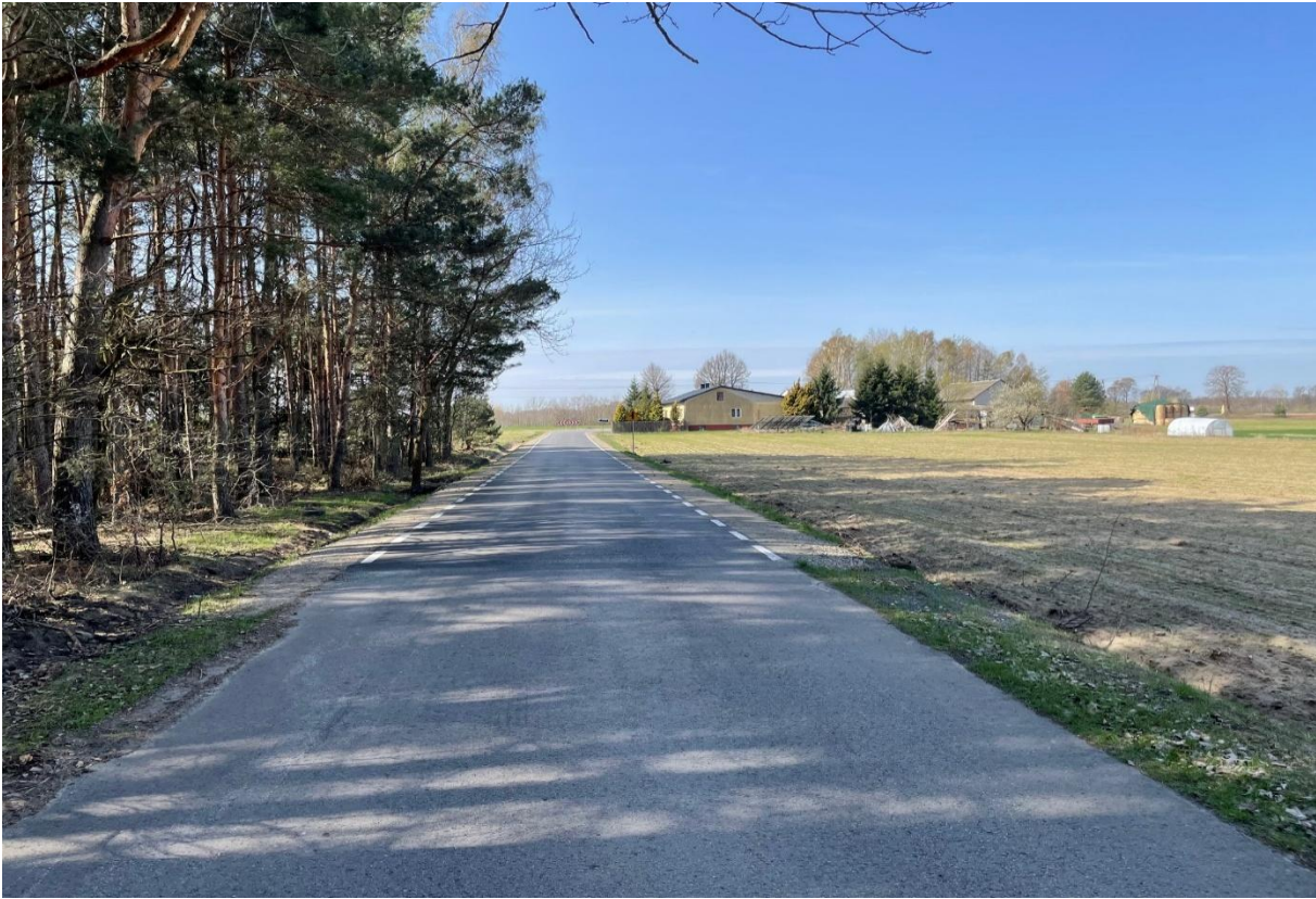
Przebudowa drogi w miejscowości Wólka Bachańska