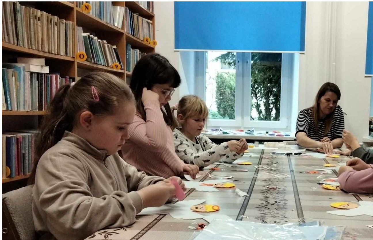
Zajęcia z dziećmi podczas ferii.