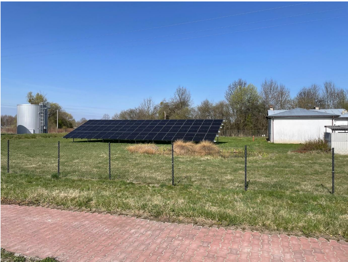
Budowa sześciu instalacji fotowoltaicznych na własne potrzeby w Gminie Gniewoszków-instalacja na hydroforni w Oleksowie