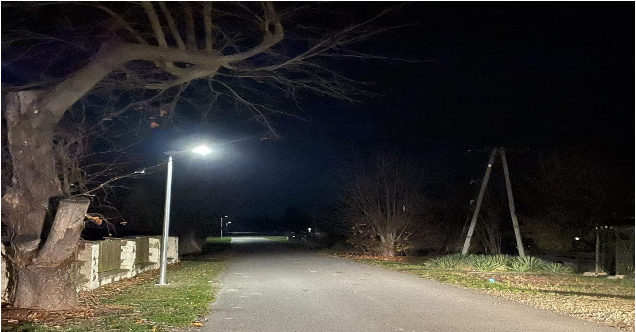
Budowa oświetlenia z własnym źródłem zasilania w gminie Gniewoszków