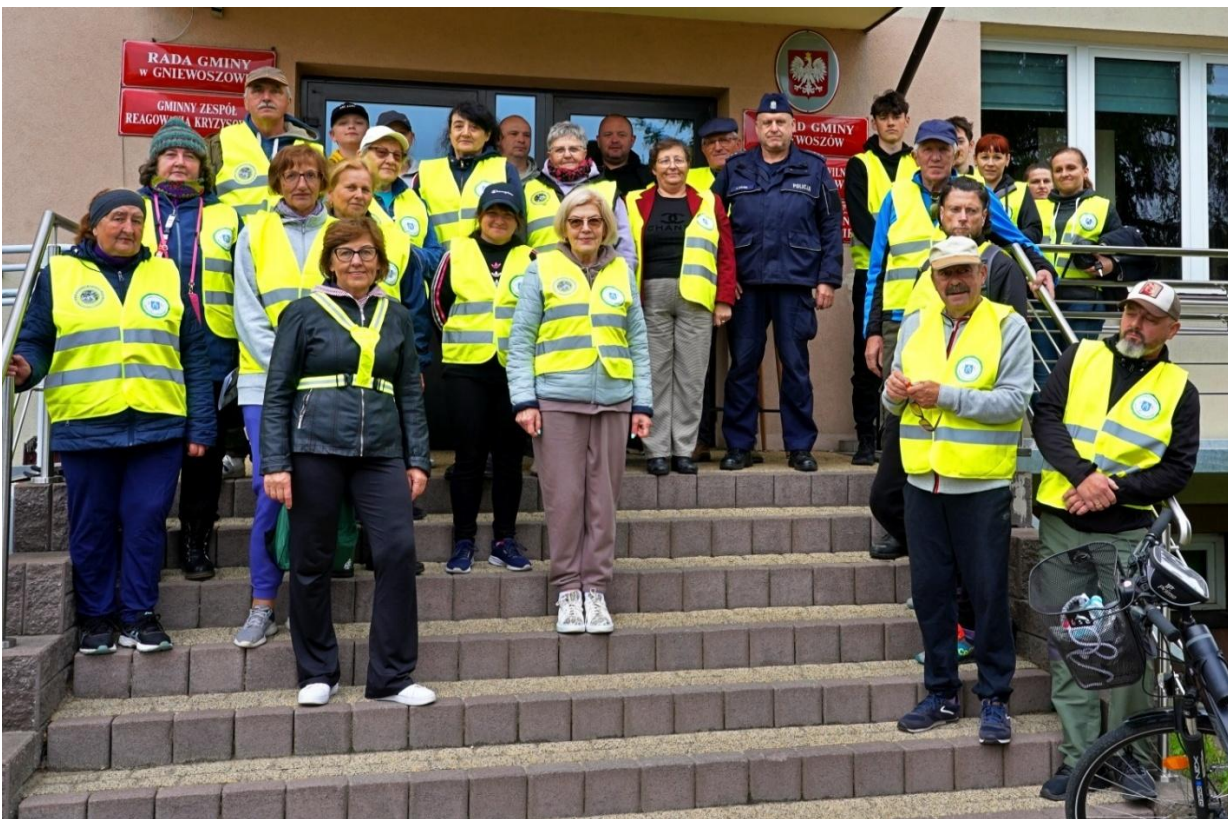
24.05.2025r. VIII Rodzinny Rajd Rowerowy „Śladami Rodzin Skłodowskich i Boguskich”.