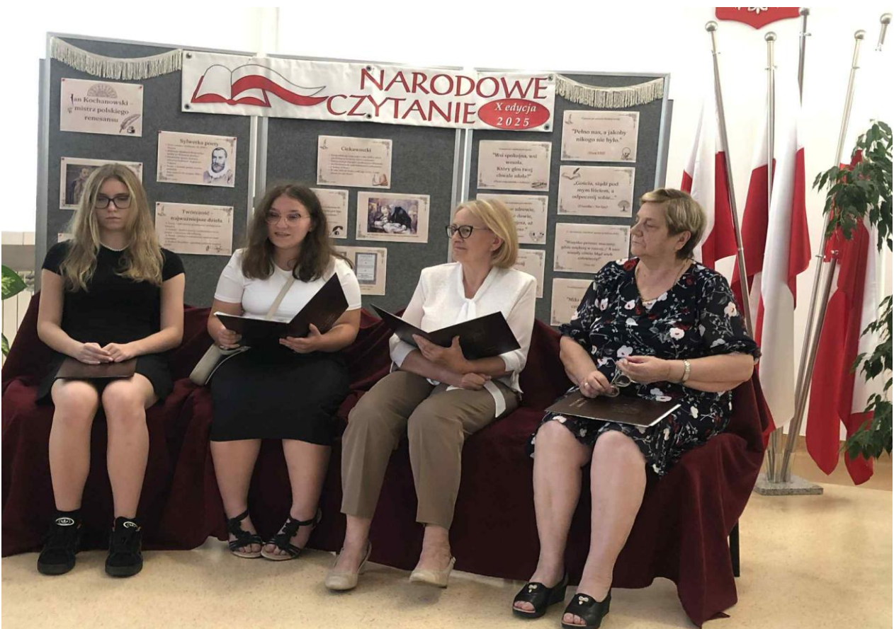
Narodowe Czytanie 2025.