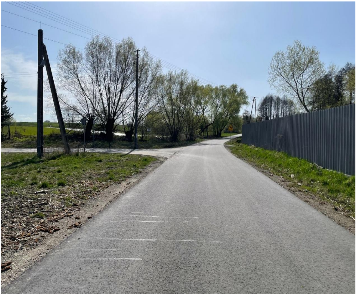
Budowa drogi gminnej w m. Zwola.