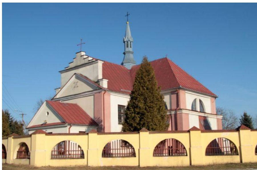
Kościół pw. św. Stanisława bp. m. w Oleksowie.

9) Uchwałą nr IV/27/24 Rady Gminy w Gniewoszowie z dnia 12 września 2024 r. przyznano dotację celową na prace konserwatorskie, restauratorskie lub roboty budowlane przy zabytkach wpisanych do rejestru zabytków położonych na terenie Gminy Gniewoszów na prace konserwatorskie, restauratorskie lub roboty budowlane przy zabytkach wpisanych do rejestru zabytków lub znajdujących się w Gminnej Ewidencji Zabytków na rzecz Parafii Rzymskokatolickiej pw. Świętego Stanisława Biskupa i Męczennika w Oleksowie, na zadanie pn. ” Remont konserwatorski zabytkowej dzwonnicy oraz ogrodzenia wokół Kościoła pw. Stanisława bp. i m.” w kwocie – 500.000,00 zł. Gmina Gniewoszów otrzymała wstępną promesę z Rządowego Programu Odbudowy Zabytków Polski Ład na zadanie w kwocie 490.000,00 zł. Prace dotyczą robót remontowo-konserwatorskich zabytkowej dzwonnicy oraz ogrodzenia wokół kościoła. Otrzymano środki z Polskiego Ładu w 2025 r. w kwocie 229.000,00 zł