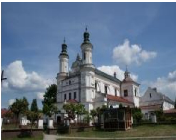
Kościół pw. Najświętszej Maryi Panny Królowej Różańca Świętego w Wysokim Kole

9) Uchwałą nr IV/27/24 Rady Gminy w Gniewoszowie z dnia 12 września 2024 r. przyznano dotację celową na prace konserwatorskie, restauratorskie lub roboty budowlane przy zabytkach wpisanych do rejestru zabytków położonych na terenie Gminy Gniewoszów na prace konserwatorskie, restauratorskie lub roboty budowlane przy zabytkach wpisanych do rejestru zabytków lub znajdujących się w Gminnej Ewidencji Zabytków na rzecz Parafii Rzymskokatolickiej pw. Świętego Stanisława Biskupa i Męczennika w Oleksowie, na zadanie pn. ” Remont konserwatorski zabytkowej dzwonnicy oraz ogrodzenia wokół Kościoła pw. Stanisława bp. i m.” w kwocie – 500.000,00 zł. Gmina Gniewoszów otrzymała wstępną promesę z Rządowego Programu Odbudowy Zabytków Polski Ład na zadanie w kwocie 490.000,00 zł. Prace dotyczą robót remontowo-konserwatorskich zabytkowej dzwonnicy oraz ogrodzenia wokół kościoła. Otrzymano środki z Polskiego Ładu w 2025 r. w kwocie 229.000,00 zł