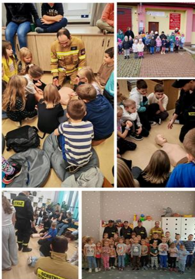
Wizyta druhów OSP Wysokie Koło w PSP w Wysokim Kole.

Strażacy z Ochotniczej Straży Pożarnej w Wysokim Kole odwiedzili społeczność PSP w Wysokim Kole, by podzielić się wiedzą i doświadczeniem z zakresu udzielania pierwszej pomocy. Spotkanie miało charakter edukacyjny, jak i praktyczny, dzięki czemu uczniowie-od najmłodszych do najstarszych-czynnie uczestniczyli w lekcji. Druhowie przygotowali interesującą pogadankę na temat zasad bezpieczeństwa oraz podstawowych czynności ratujących życie. Uczniowie obejrżeli również film edukacyjny, który w przystępny sposób przybliżył zagadnienia związane z pierwszą pomocą. Największym zainteresowaniem cieszyły się jednak ćwiczenia praktyczne- uczniowie mieli okazję spróbować swoich sił na fantomach, ucząc się m.in. resuscytacji krążeniowo-oddechowej. Lekcja została uwieczniona wspólnym, pamiątkowym zdjęciem.