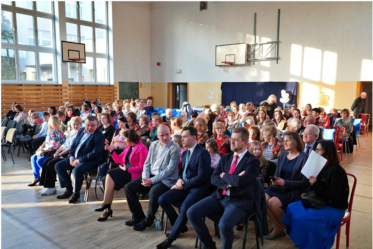
9.03.2025r. uroczyste obchody Gminnego Dnia Kobiet.