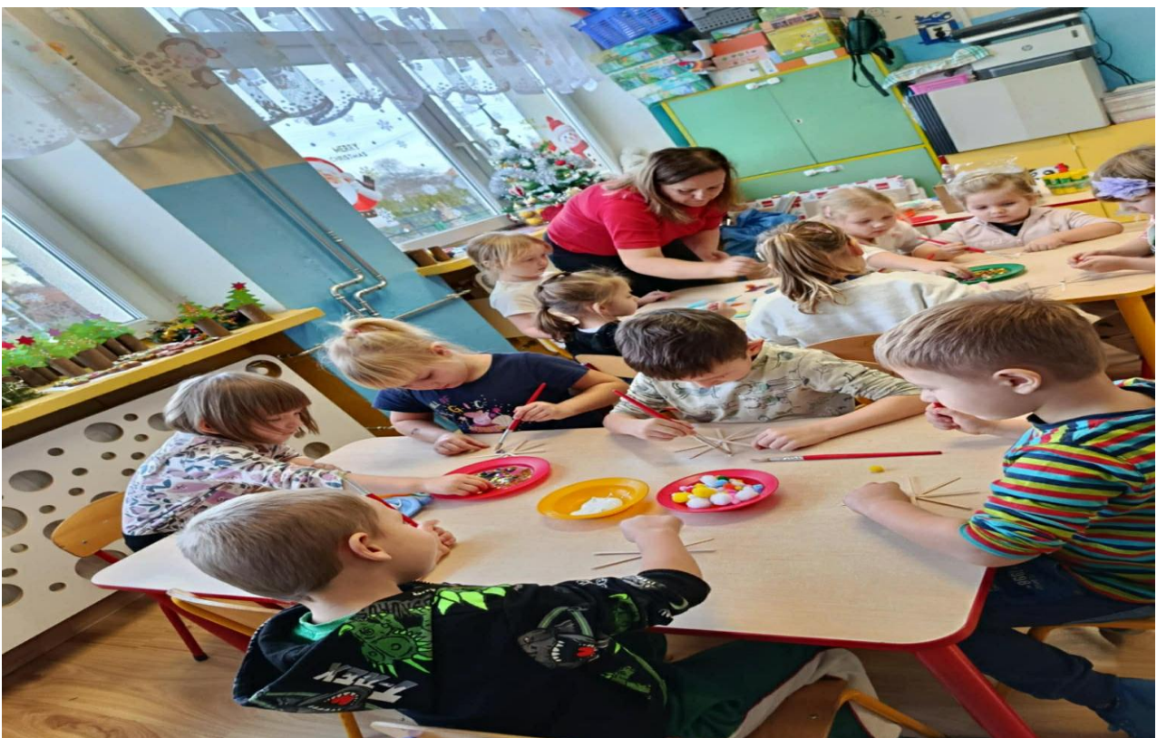
Praca z dziećmi w przedszkolu.