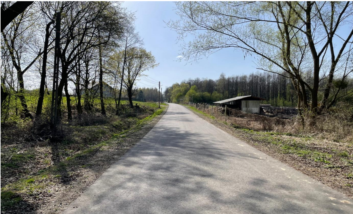
Budowa drogi gminnej w m. Sarnów