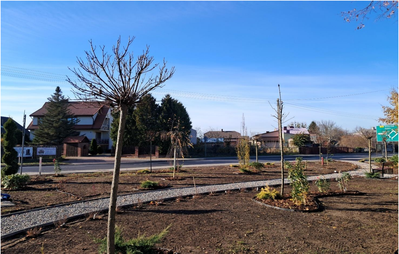
Urządzenie terenu zieleni w miejscowości Gniewoszków.