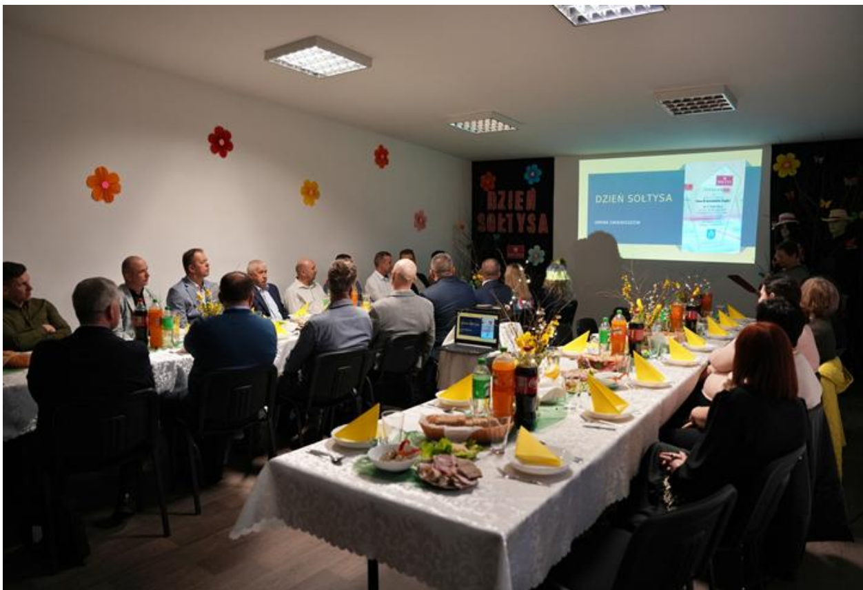
13.03.2025r. Gminny Dzień Soltysa.