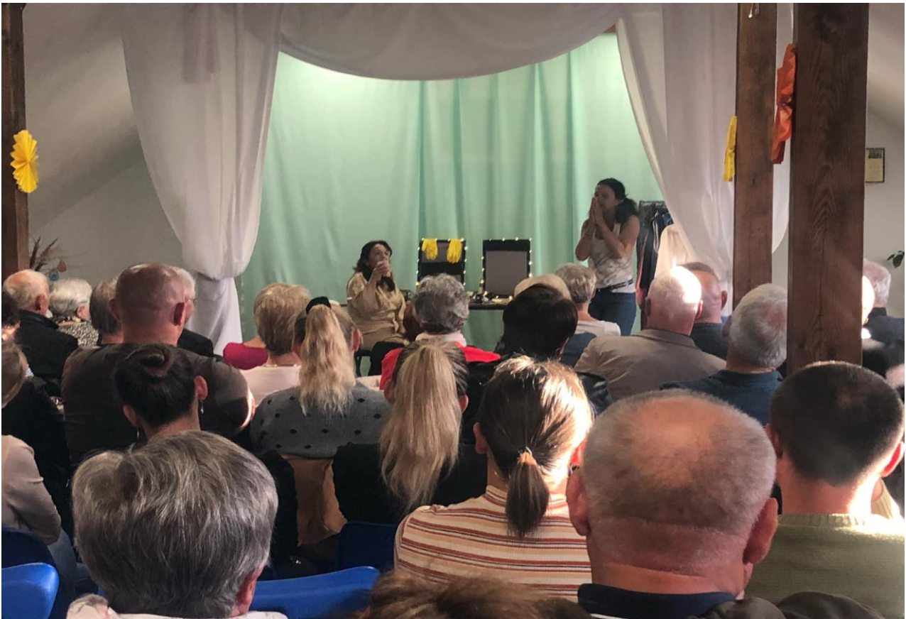
Spektakl komediowy pt. "Nago w kisielu" w wykonaniu Teatru Jedyny Taki.