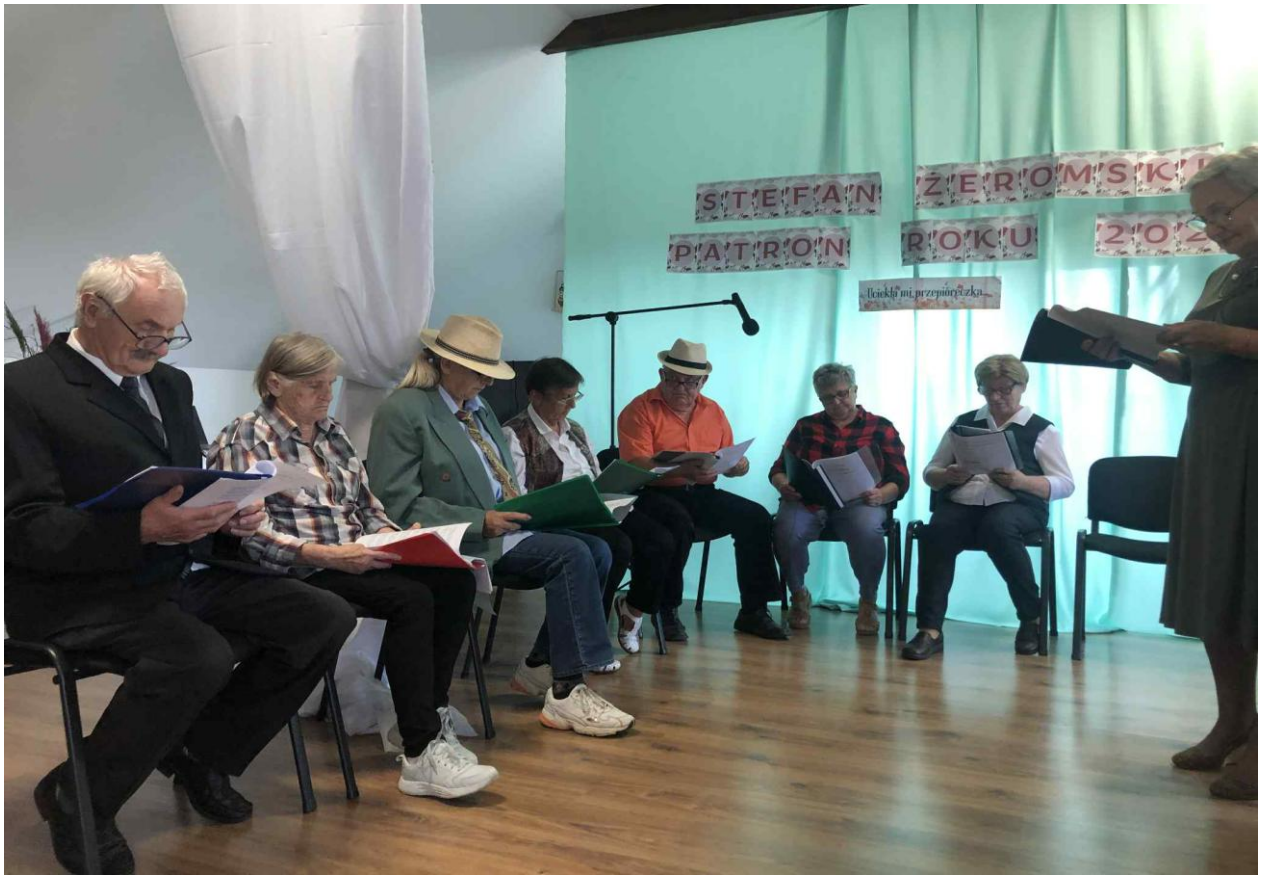
Czytanie performatywne pierwszego aktu „Uciekła mi przepióreczka” Stefana Żeromskiego.